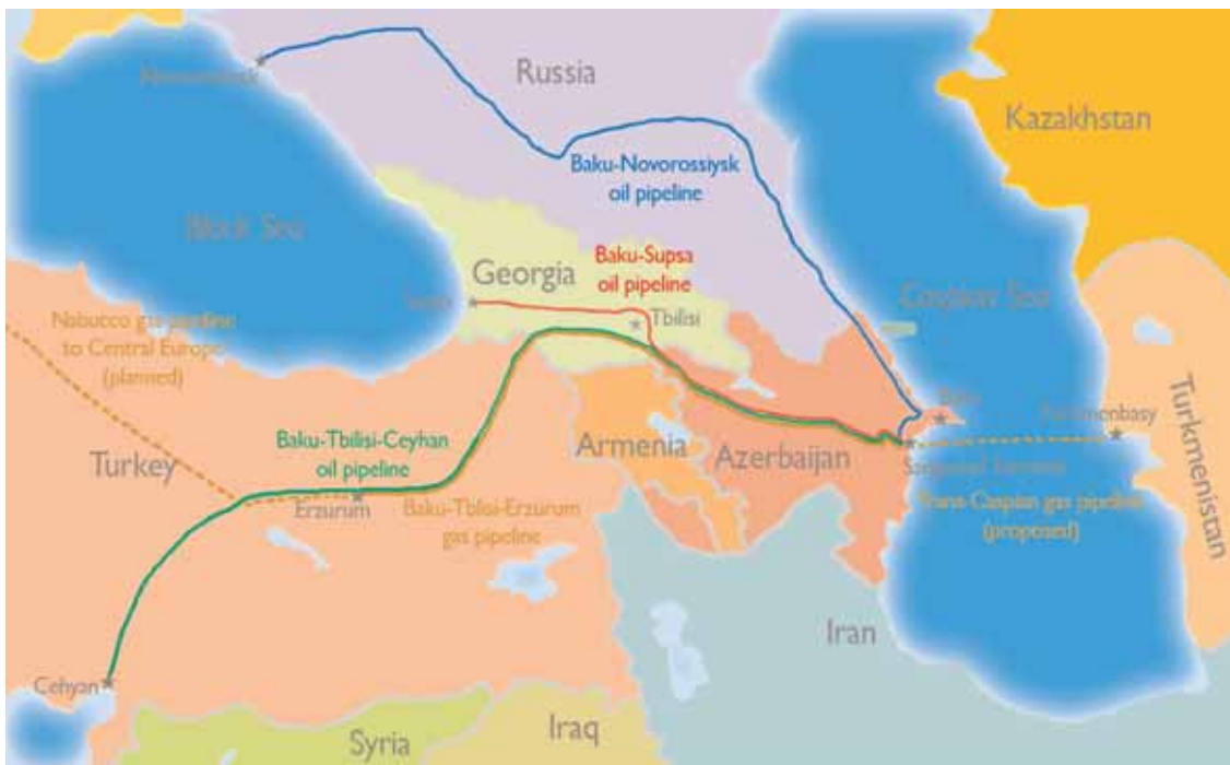
Asia minore - i principali gas- e oleodotti della regione