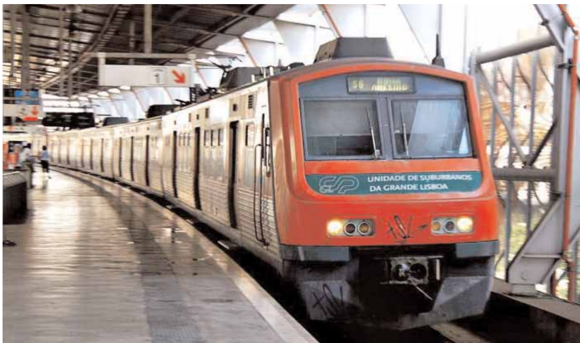
Lisbona - Un treno