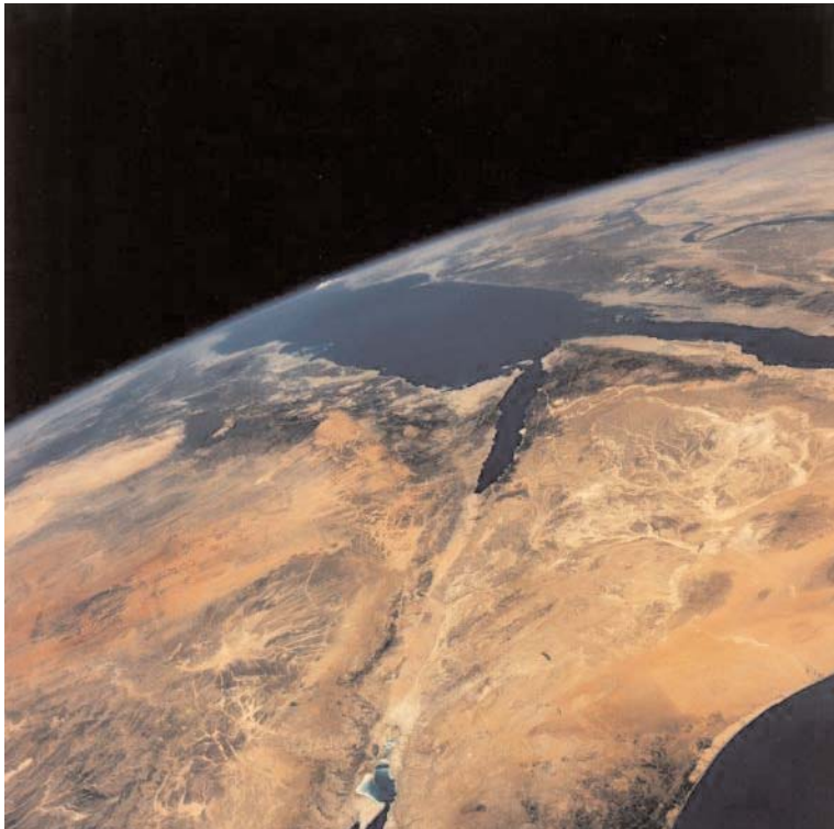
Il piccolo bacino blu-turchese in basso è il Mar Morto, quello grande in alto - in realtà il sud - il Mar Rosso. Come si può osservare nella foto, l'ipotesi della costruzione di un canale favorita dalla conformazione del terreno

Gli studi per la realizzazione del progetto sono finanziati da Francia, Stati Uniti, Giappone, Olanda, Grecia e Italia per un importo totale di circa 15 milioni di dollari. ■