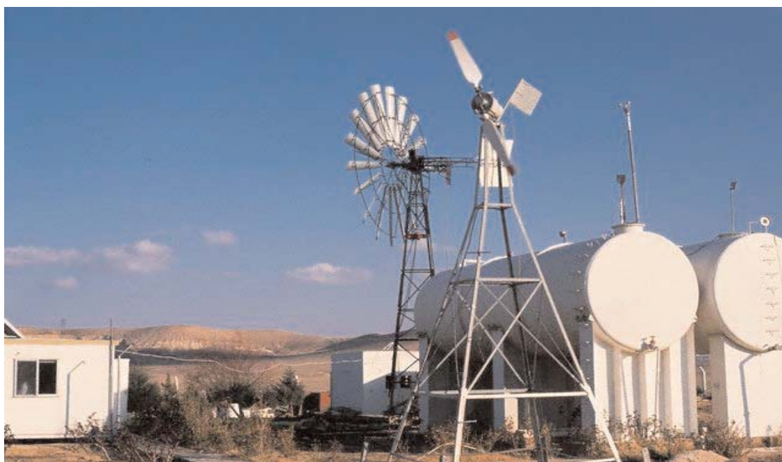
Un'impianto di pompaggio acqua alimentato dall'energia eolica nel deserto della Giordania

Un altro pilastro portante del piano energetico giordano è lo sviluppo della filiera nucleare civile, che dovrebbe contribuire anche a fornire l'energia necessaria per la desalinizzazione dell'acqua del Mar Rosso. Il Paese dispone di ingenti risorse di uranio relativamente alle quali è stato già concluso un contratto con il gruppo francese Areva. Esso prevede la produzione a regime di 2mila tonnellate da giacimenti localizzati nelle aree centrali del Paese. Le prospezioni sono appena state avviate. Le riserve giordane sono stimate in 140mila tonnellate a cui si aggiungono quasi 60mila tonnellate estraibili dai giacimenti di fosfati. »