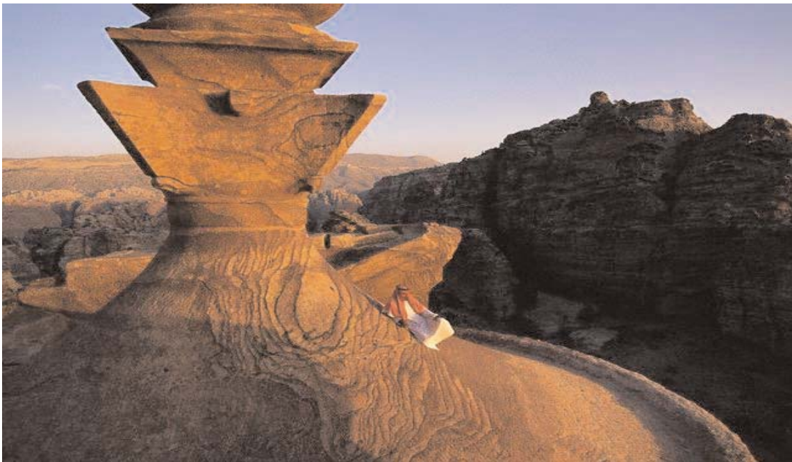
Petra - l'Ed Deir al tramonto

Nel 2008 il gruppo Condotte SpA di Roma si è aggiudicato la commessa per la realizzazione di un'operazione analoga (Ayala Oasis) che prevede la costruzione di una marina, con attiguo molo di protezione e una rete interna di laghetti, piscine, campi da golf per un'estensione totale di 430 ettari. E' previsto l'insediamento di 3mila appartamenti e di 100mila m2 destinati ad attività commerciali. L'importo della prima fase della commessa, dedicata alle opere infrastrutturali, ammonta a circa 165 milioni di euro. Ha puntato sul Mar Nero, invece, il gruppo Emaar del Dubai, che in marzo ha iniziato le prime consegne di un grande progetto di sviluppo immobiliare (Samara Dead Sea Resort) suddiviso in due fasce residenziali, una collinare e una costiera, e in un'area turistico alberghiera.