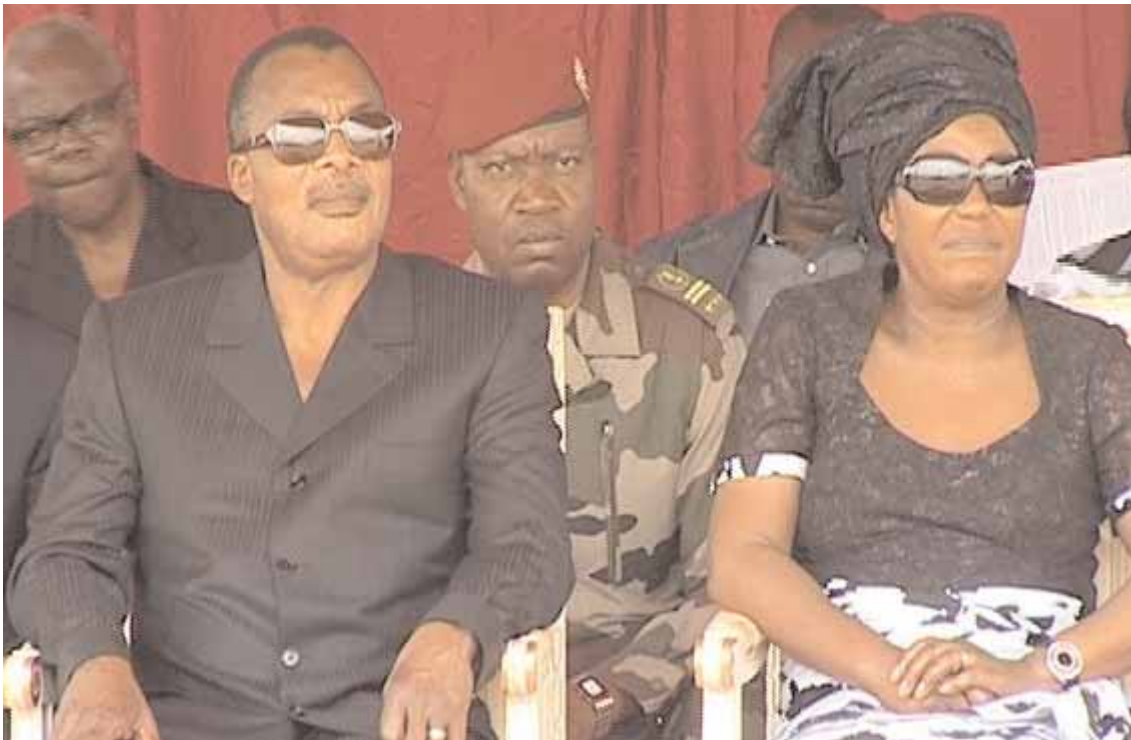
Congo Brazzaville - Il Presidente Denis Sassou Nguesso e la moglie Antoinette