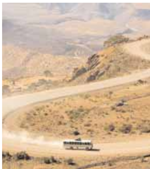
Una strada etiopica