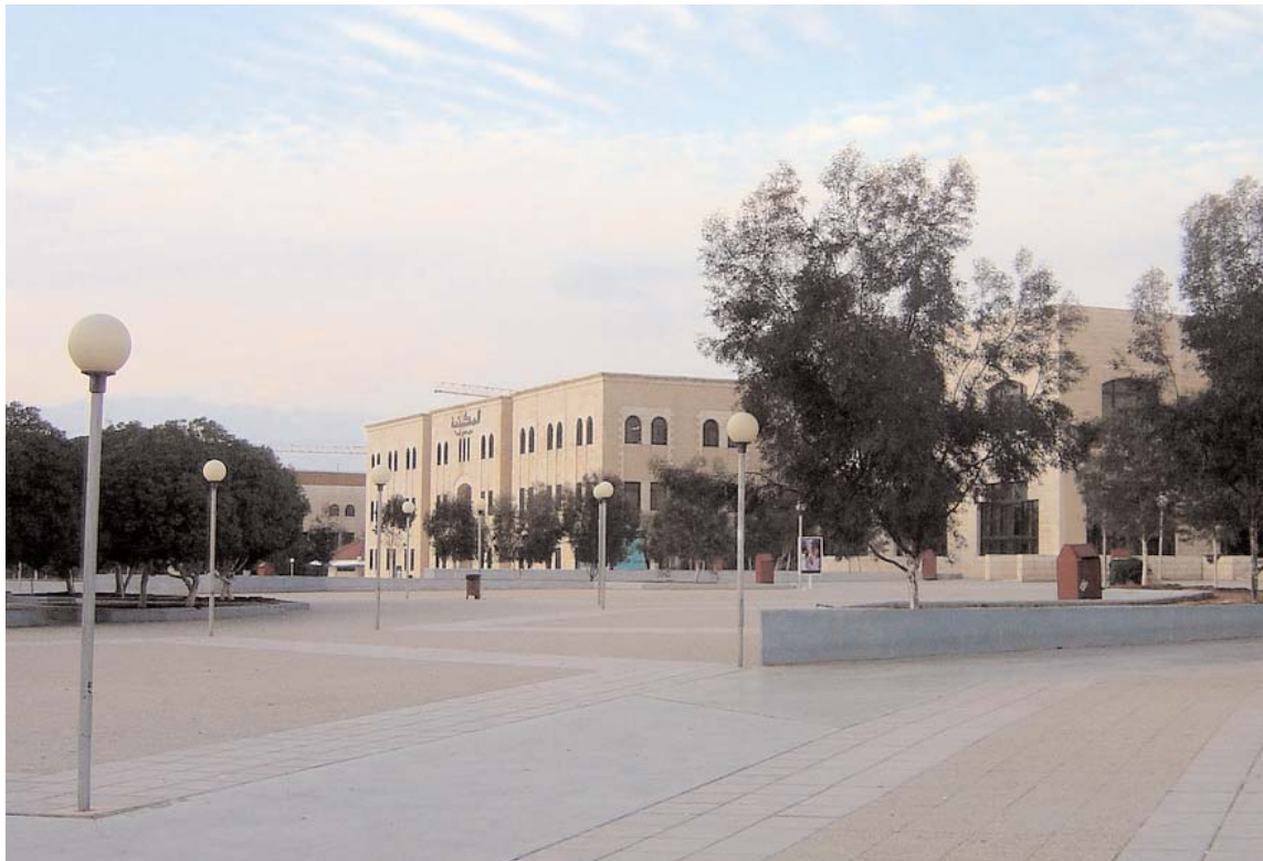
Zarqa - La Hashemite University ospita uno dei migliori ospedali della Giordania

Inoltre, anche quest'anno Operation Smile Italia si è recata in Giordania per il decimo anno consecutivo, curando oltre 120 bambini con gravi malformazioni del volto, provenienti anche dai Paesi vicini. ■