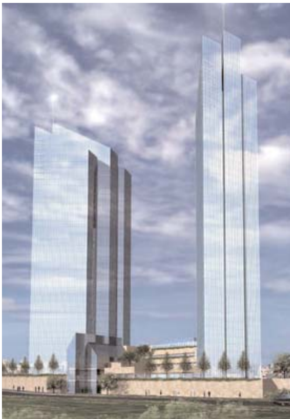
Le torri del Jordan Gate di Amman in un rendering

Sempre sulla stessa direttrice sta sorgendo il nuovo Green Village, che per la verità di verde non ha molto. Sorge su un'area di oltre un milione di m 2 e prevede uno sviluppo in due fasi la prima delle quali già in fase di commercializzazione, con la costruzione di circa 500 abitazioni di diversa taglia. ■