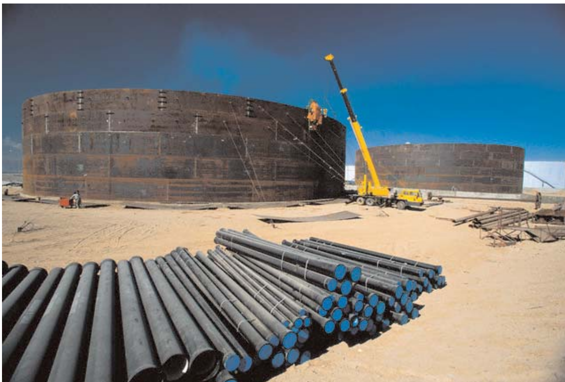
Serbatoi di stoccaggio carburante nei pressi di Aqaba

British Petroleum e alcune compagnie americane stanno effettuando ricerche per l'individuazione di ulteriori campi di idrocarburi al confine con l'Iraq in un'area da cui, attualmente, vengono già estratti limitati quantitativi di gas naturale. ■