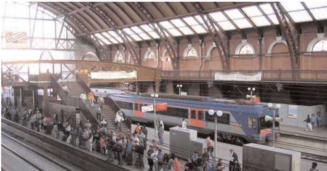
San Paolo - La stazione ferroviaria

Per la modalità di esecuzione viene proposto un partenariato pubblico-privato che includa sia la concessione dello sfruttamento della linea a una società privata sia una partecipazione finanziaria ►