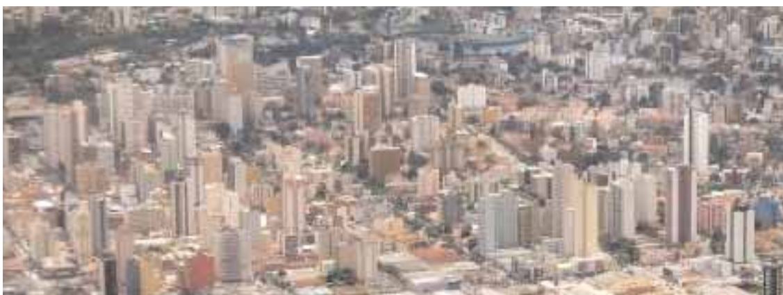
Veduta aerea di Curitiba, altra località per la quale è allo studio un progetto di collegamento ferroviario Tav