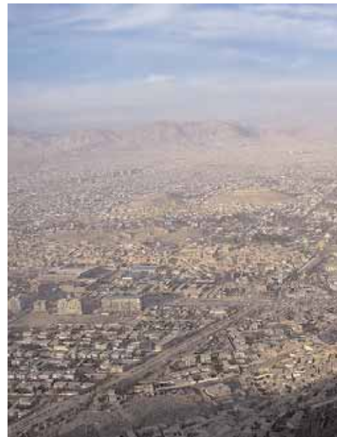
Panorama di Kabul