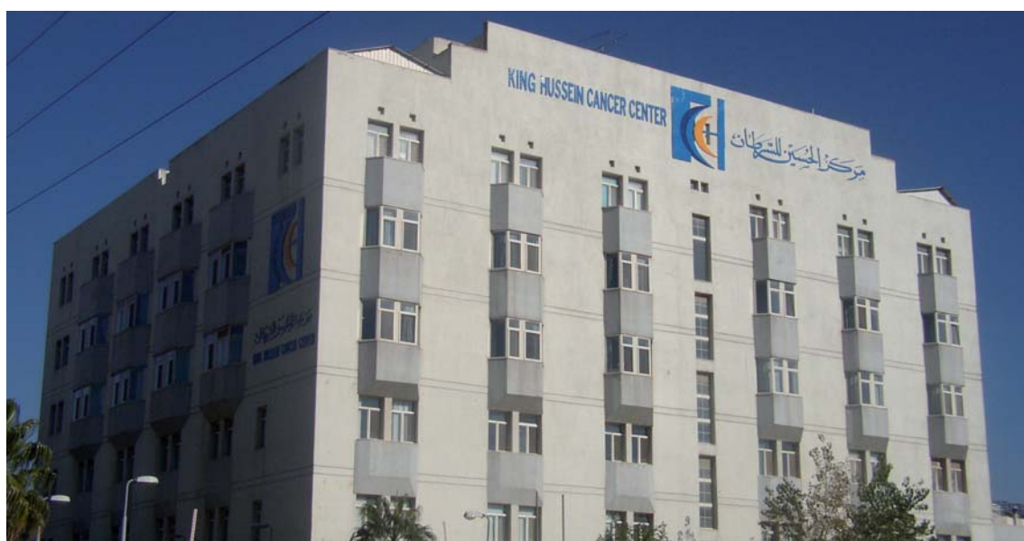
Amman - Il King Hussein Cancer Center

Il punto di forza è rappresentato dalla disponibilità di posti letto (il tasso di occupazione ospedaliera attorno al 65%) e di personale medico. Nel Paese operano quattro facoltà mediche (Jordan University of Science and Technology a Ramtha, University of Jordan ad Amman, Hashemite University a Zarqa e Mutah University ad Al Karak). Non solo, ma molti medici giordani hanno un'esperienza internazionale in quanto hanno studiato e operato all'estero. I costi per i trattamenti non sono alti. Un'operazione a cuore aperto in Giordania (la prima, effettuata presso l'ospedale militare di Amman, risale al 1985) oggi costa attorno ai 15mila dollari rispetto a una cifra superiore di almeno sei volte in Usa. Non stupisce quindi che tra i 'turisti della salute' arrivati nel Paese le statistiche includano anche 2mila cittadini statunitensi. ▶▶