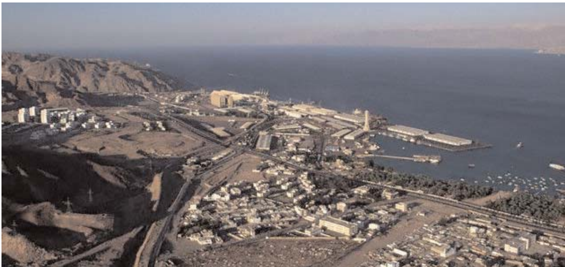
Veduta aerea di Aqaba

Il costo complessivo dei diversi interventi sarebbe, secondo una prima stima, di 4,2 miliardi di euro, di cui 2,8 per le infrastrutture di base e il restante per il materiale rotabile e le infrastrutture di manutenzione. Le modalità di copertura finanziaria non sono ancora state definite. Il piano ferroviario consentirebbe di consolidare il ruolo del porto di Aqaba come hub regionale in direzione di Arabia Saudita, Siria e Irak. ■