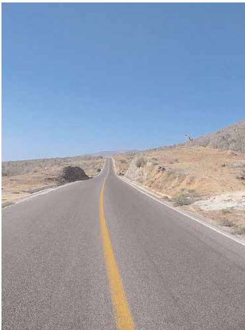
Messico - La Highway 19