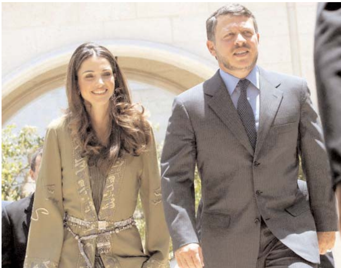
Abdullah II di Giordania con la regina Rania