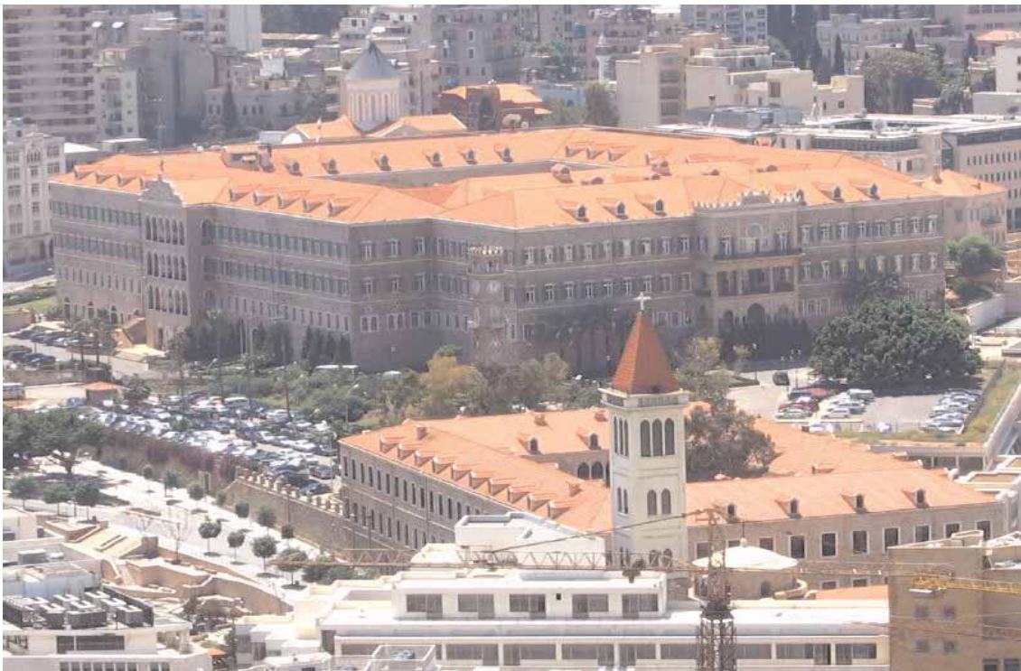
Beirut - Il Gran Serraglio

Contribuisce anche il rientro di capitali detenuti da cittadini libanesi residenti all'estero. Molti infatti, in un contesto di turbolenze dei mercati finanziari mondiali, hanno preferito riportare i soldi a casa dove le banche sono ritenute più affidabili. ➤