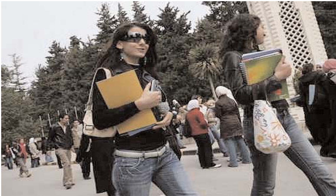
Studenti all'Università di Amman

Ad Amman è insediata poi una sede del New York Institute of Technology mentre ad Aqaba dovrebbe diventare operativa, dal prossimo anno, la British University, affiliazione dell'Università di Coventry con corsi in ingegneria aerospaziale, management, scienze turistiche.